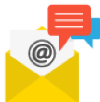
跨渠道數位營銷系統 E-marketing