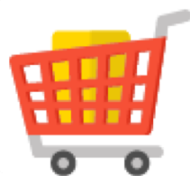
網上商店系統 Online Store

RADICA將向零售、消費品、美容及化妝品等行業，將為100個合適的商戶提供專業營銷解決方案，通過不同的營銷軟件組合滿足不同行業的精準營銷需求，幫助企業加速數字化營銷推廣、優化客戶體驗、提高 ROI，最終為企業創造更多價值。