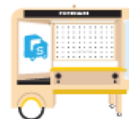
5G流動無人 AI遙距零售解決方案